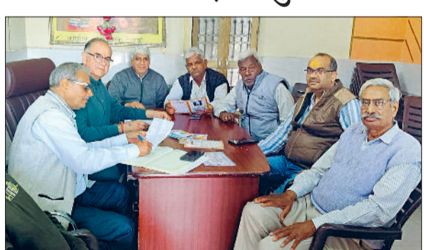
रेवाड़ी। बैठक में उपस्थित ब्राह्मण सभा के पदाधिकारी।