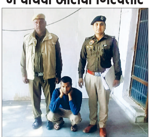
रेवाड़ी। पुलिस गिरफ्त में बाइक चोरी का आरोपी।

पुलिस इस मामले में चार आरोपियों को पहले ही गिरफ्तार कर चुकी