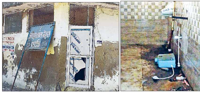
रेवाड़ी। नेहरू पार्क के पास जर्जर हालत में सार्वजनिक शौचालय, पब्लिक टॉयलेट में टूटे पड़े उपकरण।

नए अधिकारियों के अनुसार पब्लिक टॉयलेट के सुधारीकरण को लेकर कार्य शुरू किया जा चुका है। कई सार्वजनिक शौचालयों की सीट, पानी की टंकी, वाशबेशन व दरवाजे तक टूट चुके हैं, वहीं नल और प्लश भी खराब स्थिति में हैं।