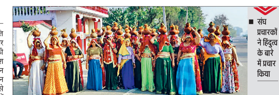
रेवाड़ी। कलश यात्रा निकालते हुए महिलाएं।