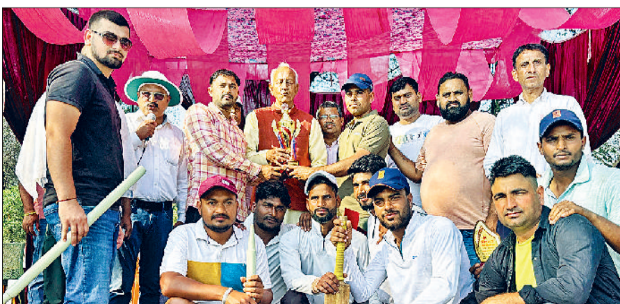
रेवाड़ी। विजेता टीमों को सम्मानित करते मुख्य अतिथि।