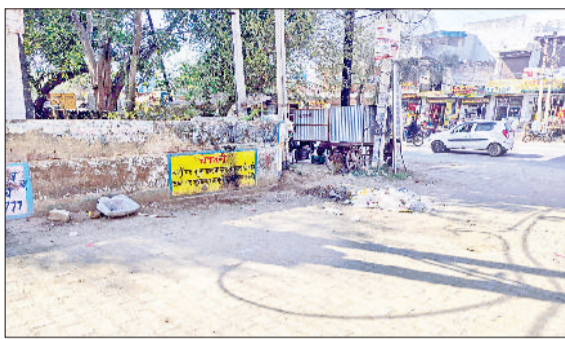
मंडी अटेली। अटेली अनाज मंडी में महिला शौचालय पर लगा ताला व अनाज मंडी के मुख्य द्वार के सामने पड़ा कूड़े का ढेर।

को शर्त पर बताया कि शौचालय बंद होने से उन्हें अत्यधिक दिक्कतें झेलनी पड़ रही हैं। कई बार घंटों इंतजार करना पड़ता है या फिर आसपास अनुविधानिक स्थानों का सहारा लेना पड़ता है। उन्होंने आरोप लगाया कि शिकायतों के बावजूद उनकी कोई सुनवाई नहीं हो रही। अटेली अनाज मंडी में करीब 240 दुकानें संचालित हैं, जहां रोजाना सैकड़ों किसान व्यापारी और महिलाएं पहुंचती हैं। आगामी गेहूं और सरसों के सीजन को देखते हुए मंडी में आवाजाही और भी बढ़ने वाली है, लेकिन व्यवस्थाओं का हाल