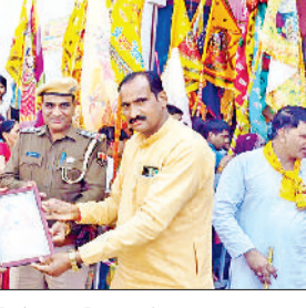
मंडी अटेली। जैतपुर मंदिर में पुलिस कर्मियों को सम्मानित करते हुए।

दर्शन कर मन्नत मत्था टेक मांगते हैं। वर्तमान में जैतपुर धाम ने बड़ा धाम का रूप ले लिया है। भक्तों द्वारा जगह-जगह जल शिविर व भंडारा लगाकर भक्तों की सेवा की जा रही