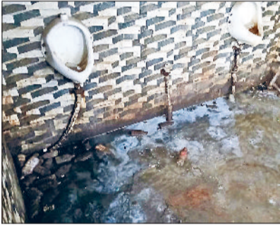
पब्लिक टॉयलेट में सफाई न होने से गंदगी का आलम।

नगर परिषद की ओर से शौचालयों के रखरखाव व सफाई के नाम पर प्रति वर्ष लाखों रुपये खर्च किए जाते हैं। महाराणा प्रताप चौक, गोकल गेट, बारा हजारी, नाईवाली चौक, सती कॉलोनी, रेलवे रोड, अनाजमंडी के पास और रेलवे रोड सहित कई जगह शौचालयों में गंदगी का आलम छाया हुआ है। इनमें से कई शौचालय जर्जर हालत में आ चुके हैं। मोबाइल टॉयलेट भी खराब स्थिति में हैं। नगर परिषद की ओर से दिसंबर 2024 में 44.62 लाख रुपये की लागत से 22 शौचालयों और 7 यूरिनल स्पॉट की मरम्मत कराने के लिए टेंडर जारी किया गया था। लेकिन कार्य में खानापूर्ति की गई और शौचालयों की हालत में सुधार तक नहीं हुआ।