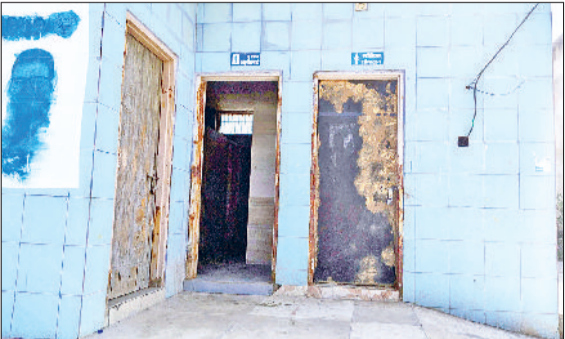
मंडी अटेली। अटेली अनाज मंडी में महिला शौचालय पर लगा ताला व अनाज मंडी के मुख्य द्वार के सामने पड़ा कूड़े का ढेर।