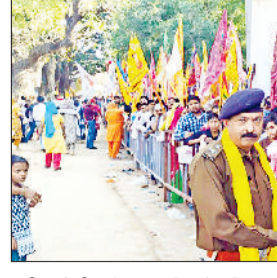
मंडी अटेली। जैतपुर मंदिर में पुलिस कर्मियों को सम्मानित करते हुए।