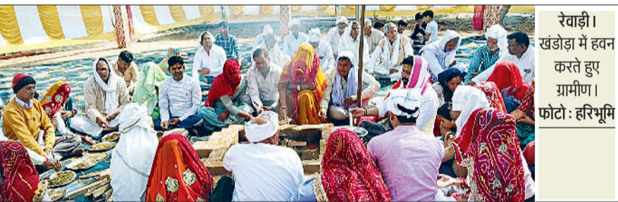
बावल